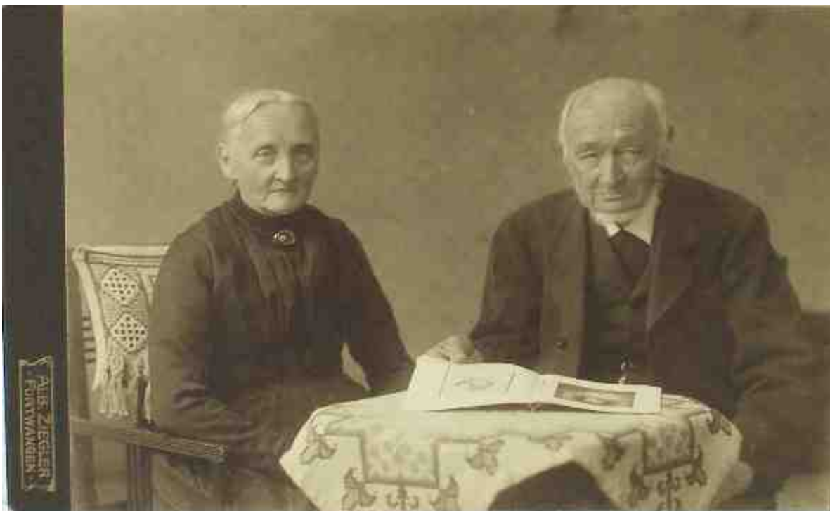
Eintrag auf der Rückseite: Die Frau allein