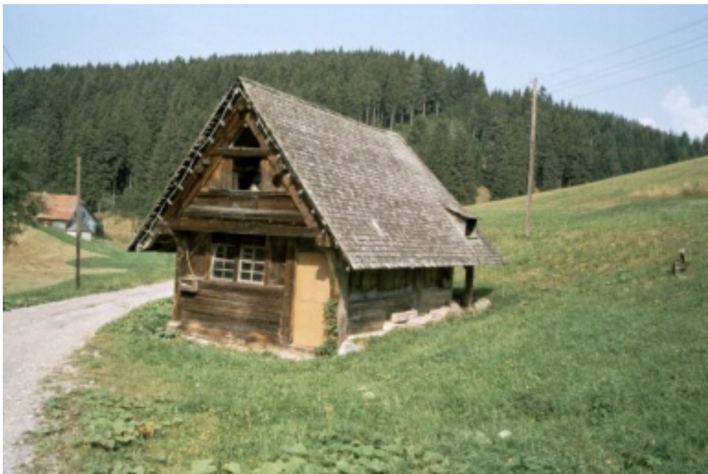
Mühle vom Kernbauernhof von hinten