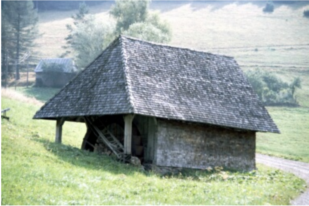
Mühle vom Kernbauernhof von vorn